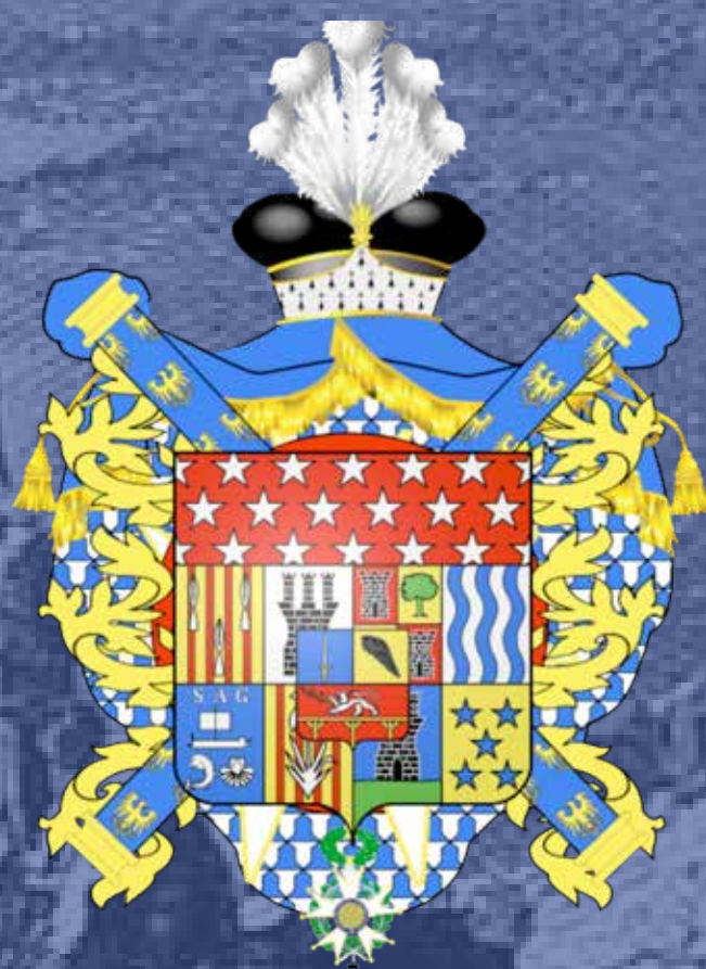
Blasó de mariscal de França i comte de l'Imperi de Louis Gabriel SOUCHET, concedit per Napoleó per la caiguda de Tarragona

La caiguda de "Tarragone la Forte", com l'anomenava Napoleó, suposà pel general Louis Gabriel Suchet el Bastó de mariscal de l'Imperi.